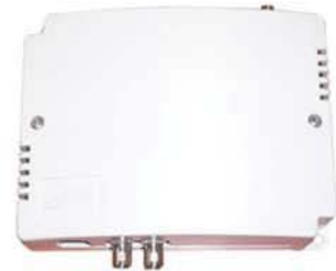
TIP 200 TIP 200 GPRS

Equipos de transmisión de imágenes por GPRS o LAN: