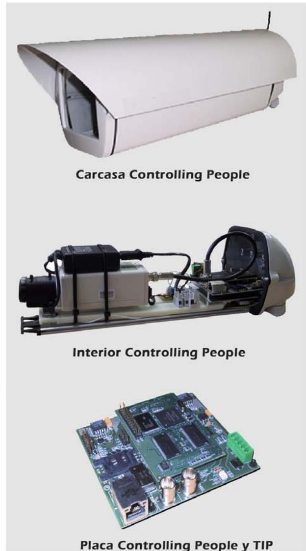
Carcasa Controlling People